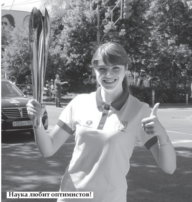
Наука любит оптимистов!

- Аспирантура помогает самореализоваться, раскрыть свой научный потенциал. Здесь молодые ученые выбирают для себя интересующее и актуальное научное направление, определяются с темой исследования, изучают литературу по выбранной теме, проводят ряд экспериментов, получают и систематизируют данные, сравнивают полученные ре-