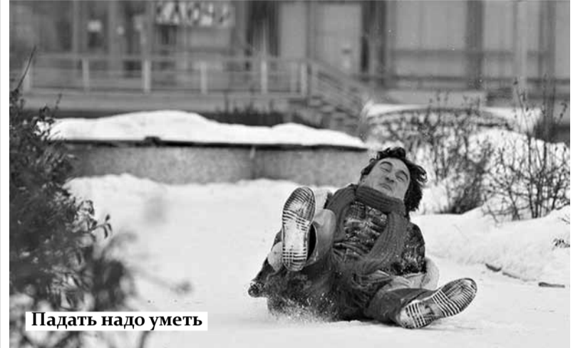
Падать надо уметь

Смена температурного режима и гололед на дорогах часто являются причиной травм. Результаты падений разные: от ушибов и вывихов до переломов и черепно-мозговых травм. Помните, лучшая профилактика травм – это осторожность и осмотрительность!