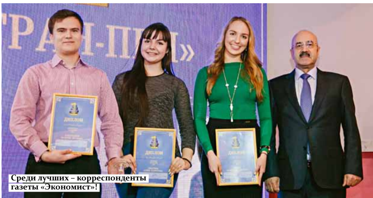
Среди лучших – корреспонденты газеты «Экономист»!

Со своей стороны отмечу, что ректорат и профессорско-