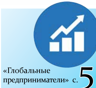
«Глобальные предприниматели» с. 5