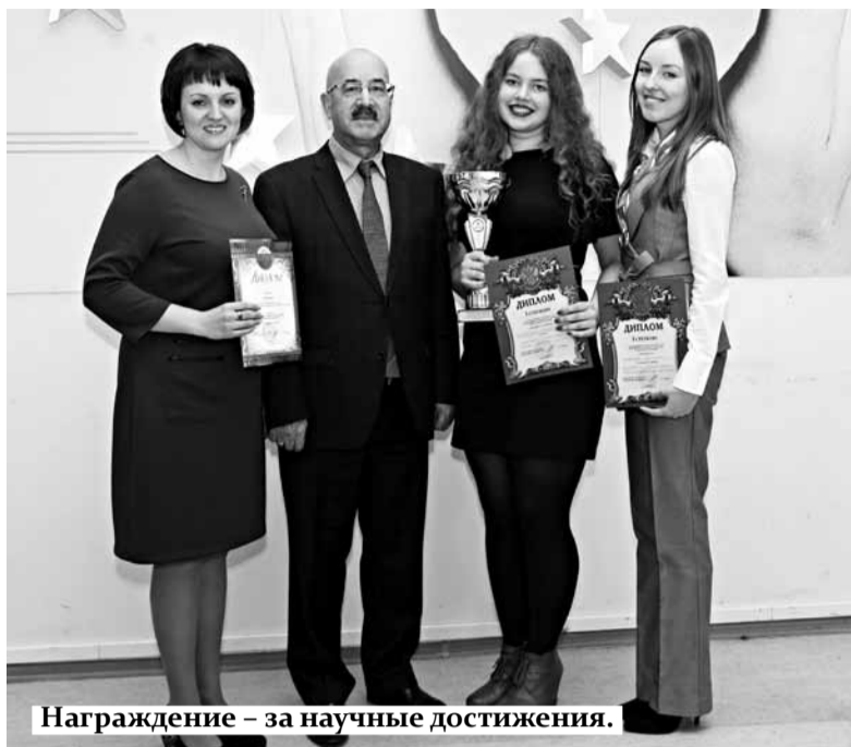
Награждение – за научные достижения.

Этот проект СГЭУ чрезвычайно актуален и важен для развития субъектов РФ, поскольку региональные топливно-энергетические балансы в современной России нигде не разрабатываются. Он стал продолжением многолетних научных исследований Лаборатории комплексных региональных исследований СГЭУ. В 2016 году научный коллектив СГЭУ совместно с Российским университетом дружбы народов провел исследование на тему «Энергосбережение как основной фактор снижения энергоёмкости ВРП (исследование на основе формирования и анализа топливно-энергетического баланса субъекта РФ)», результаты которого легли в основу совместной заявки на конкурс Министерства образования и науки РФ.