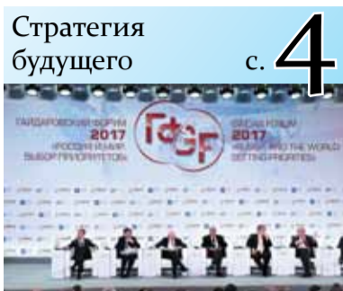
Стратегия будущего с. 4