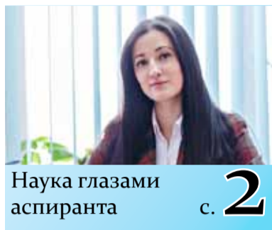
Наука глазами аспиранта с. 2