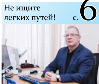
Не ищите легких путей! с. 6