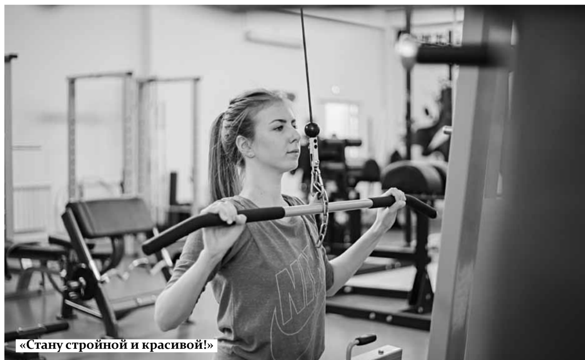
«Стану стройной и красивой!»

Двери физкультурно-оздоровительного комплекса «Чайка» всегда открыты для вас! Мы находимся по адресу: г. Самара, ул. Советской Армии, 141, лит.Ф, тел.: 933-86-84, 933-86-85. Будьте здоровы!