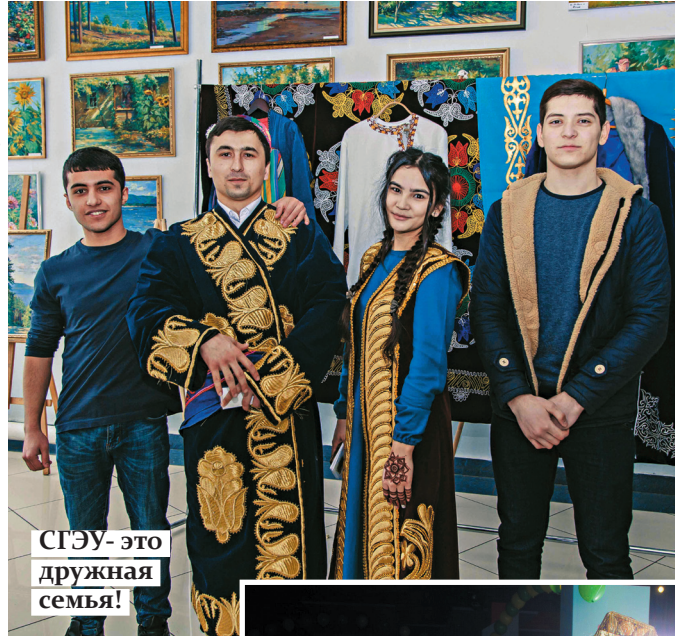
СГЭУ- это дружная семья!

– С родителями на таджикском, а с друзьями по-разному. С подругами по привычке разговариваем на таджикском. Знаешь, мы очень уважительно относимся друг к другу, поэтому почти