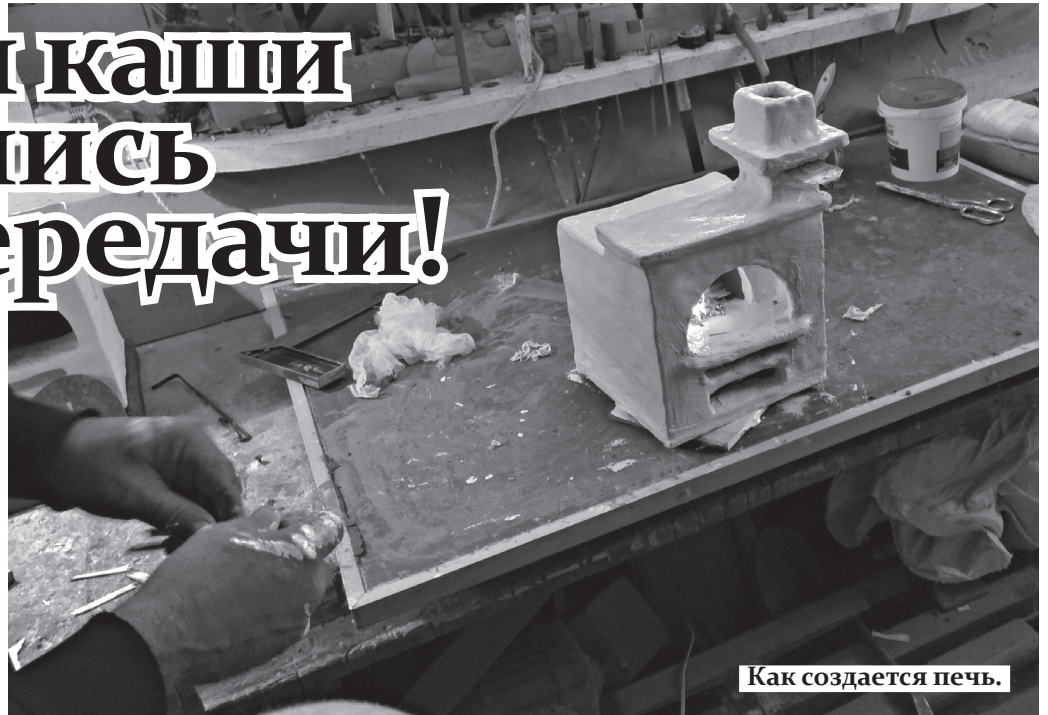
Как создается печь.