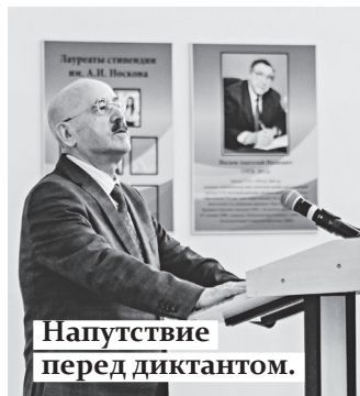
Напутствие перед диктантом.