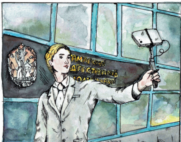
Рисунок А. Кучко.

Она активная, веселая, отзывчивая. Мы наперебой задавали ей вопросы обо всем, а Вика терпеливо отвечала каждому. В СГЭУ любят первокурсников, по-доброму шутят над нашими перепуганными лицами и ласково называют «первашками».