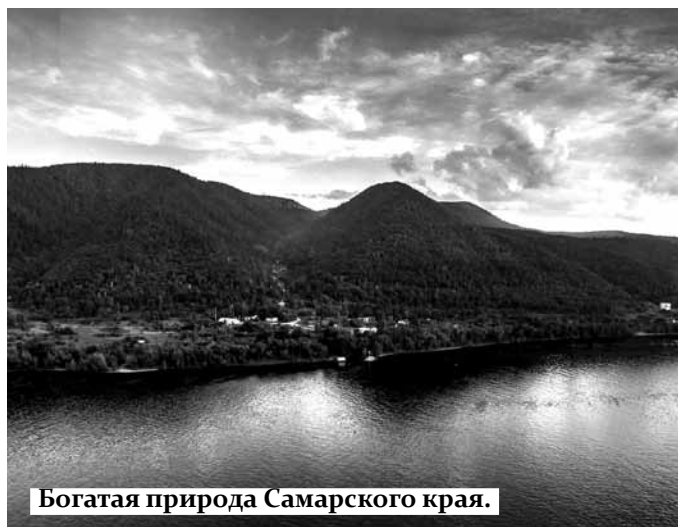
Богатая природа Самарского края.

Главная цель экотуриста – посещение относительно не тронутых антропогенным воздействием природных территорий. Главная прелесть такого отдыха – это его доступность, в нашей области есть множество загадочных и удивительных мест. Мы попросили студентов разных курсов назвать места, которые они считают наиболее подходящими для такого отдыха. У нас получился следующий рейтинг: