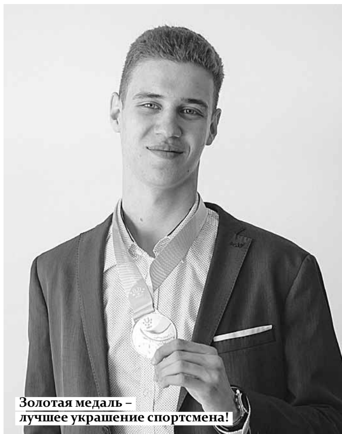
Золотая медаль – лучшее украшение спортсмена!

Тхэквондо я занимаюсь уже тринадцать лет, буквально с первого класса. Конечно, это очень непростой вид спорта – травмоопасный. Спасибо родителям за то, что они поддерживали меня и поощряли продол-