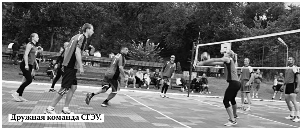
Дружная команда СГЭУ.

Начинала команда СГЭУ скромно, но достаточно уверенно – девятое место, затем восьмое, седьмое и сразу же второе по области. Команда СГЭУ всегда входила в число призеров, что произошло и на этот