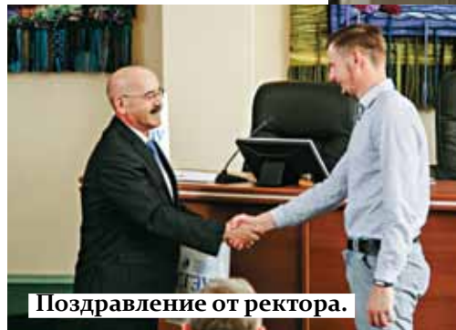
Поздравление от ректора.

– Еще в сентябре 2016 года, когда я услышал о программе «Локальное и глобальное предпринимательство», мне пришла идея создать какой-нибудь интернациональный проект. Тогда я еще не понимал, каким он будет. Опыт создания международного проекта у меня уже был на