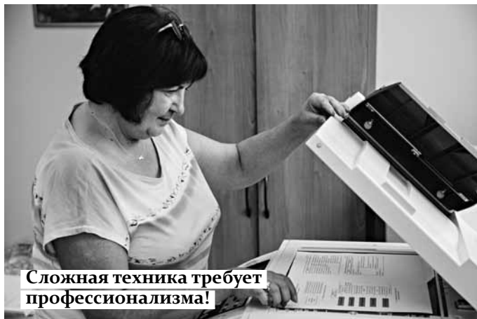
Сложная техника требует профессионализма!