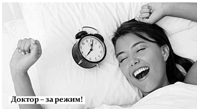
Доктор – за режим!

Лекция – это не урок, где разбирается все по полочкам. Текст начитывается практически без остановки, так что без самостоятельной работы дома не обойтись. В итоге нагрузка на организм возрастает.