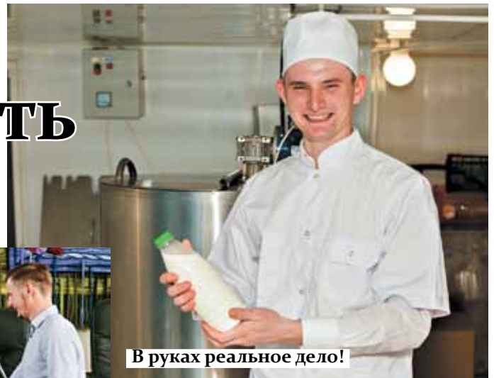
В руках реальное дело!