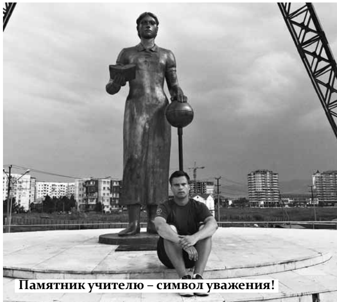
Памятник учителю – символ уважения!

Официальный старт был дан в городском МФЦ, который, кстати, очень современный и востребованный населением. В его стенах прошла встреча с представителями министерства национальной политики и министерства по делам молодежи Республики Дагестан. Остаток дня был посвящен знакомству с городом: набережная, памятник русской учительнице, музей истории, старая Махачкала, променады по береговой линии. Ближе к вечеру разыгрался шторм, и приходилось наблюдать резкие порывы ветра с огромными морскими волнами.