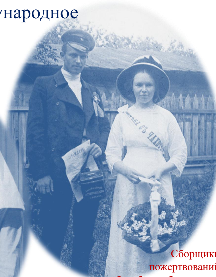
Сборщики пожертвований на борьбу с туберкулезом в «День Белой ромашки», Москва, 1912 г.