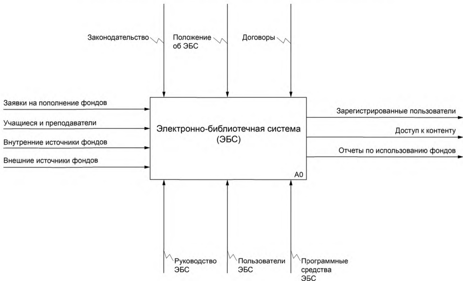
Рисунок А.1 — Контекстная диаграмма