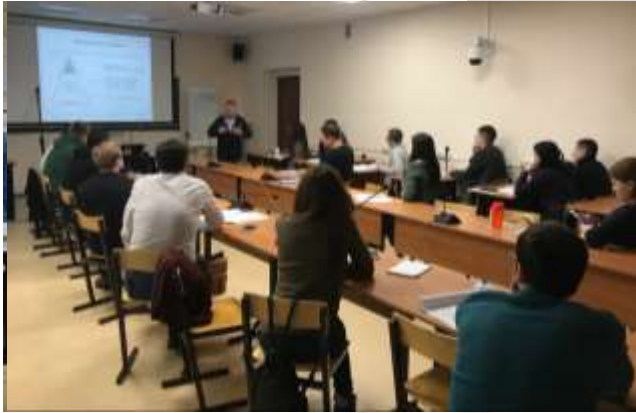
Точка кипения СГЭУ на ул.Галактионовская