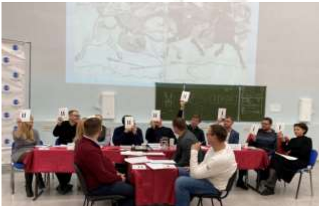
Кампус СГЭУ на ул.Советской Армии