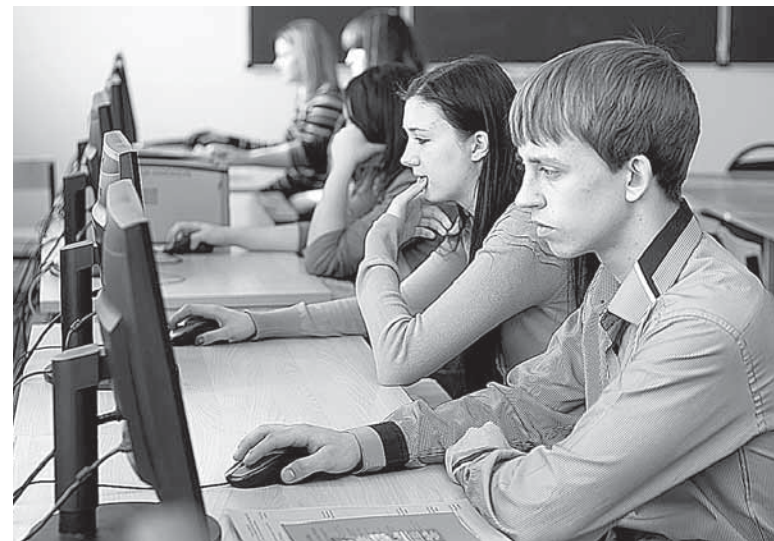
Студенты занимаются научными изысканиями с удовольствием

Всего в конференции приняли участие более 1000 участников из 54 регионов РФ и стран ближнего зарубежья.