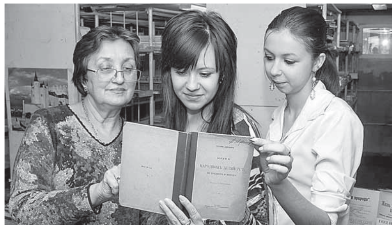
Студенткам показывают редкие книги

Начиная с весны на базе университета будут проходить матчи чемпионата Высшей лиги, пока площадка СГЭУ используется в качестве тренировочной базы команды «Самара-СГЭУ».