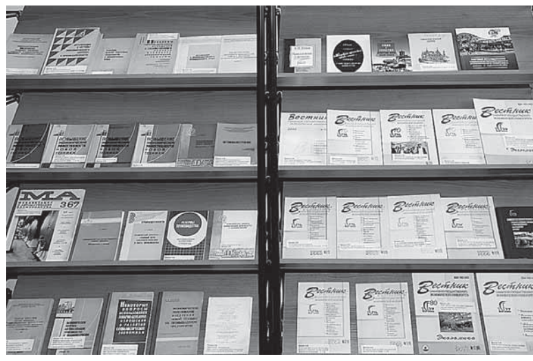
Все эти книги были написаны Анатолием Ивановичем Носковым