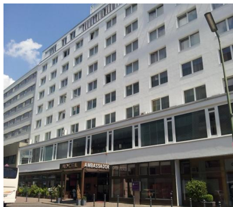
Отель SORAT Hotel Ambassador***