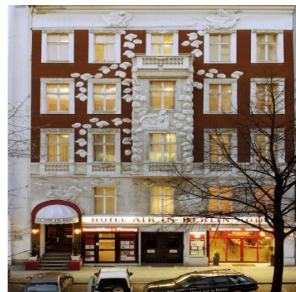
Отель Air in Berlin***