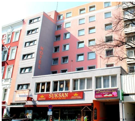
City-Hotel Ansbach am Kurfurstendamm***